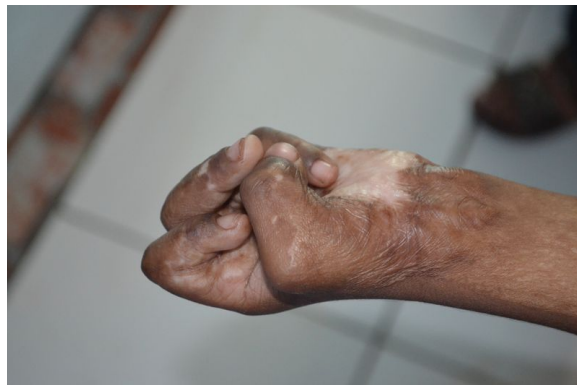
De hand van Imtiaz, 4 jaar. Op 2-jarige leeftijd door open vuur verbrand.